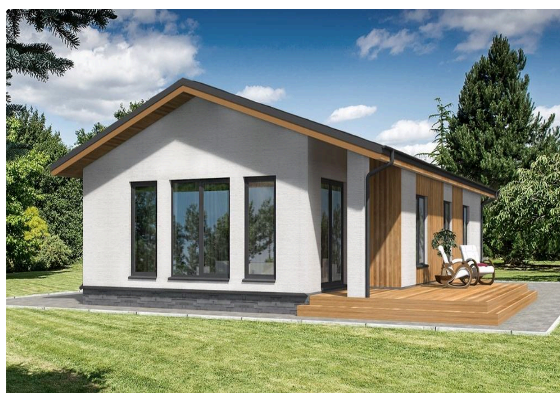
Дом из газобетона ДГБ-10.13-123 одноэтажный