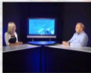
Интервью передаче "Наш регион", 2017 г.