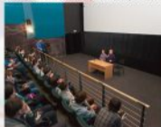
На кастромской премьере фильма "Стартан", 2004