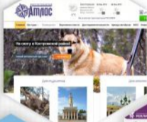
Рекламное агентство "Реклама Центр"