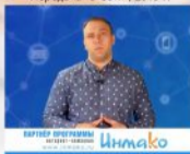
Передача "В Сети", 2019 г.