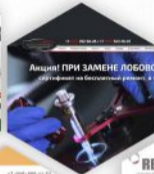
Интернет-магазин автостекла AutoGlassWorld