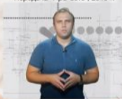
Передача "Про Сеть", 2018 г.