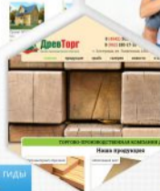
Торгово-производственная компания "ДревТорг"