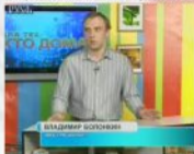
В передаче на телеканале "Русь", 2013 г.