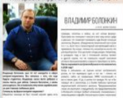
Интервью журналу "Номер" 2019 г.