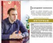
Интервью журналу "Номер", 2015 г.