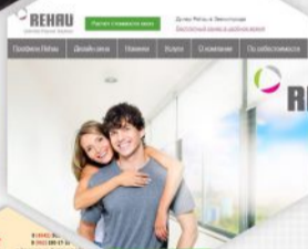
Официальный дилер пластиковых окон Rehau