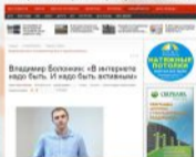
Интервью интернет-порталу Ко44.тс, 2014 г.