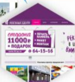
Рекламное агентство "Реклама Центр"