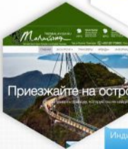
Индивидуальные гиты в Малайзии